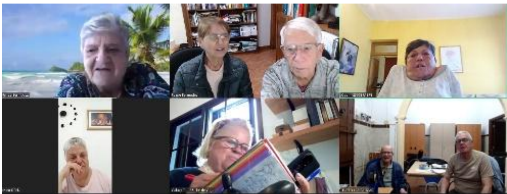
Los 8 miembros del Equipo Dioceano en una de sus reuniones de los miércoles

La experiencia ya de cinco años reuniéndonos así es altamente positiva. Y creemos que que otros movimientos e instancias eclesiales podrían trabajar también de esta forma. Porque la Diócesis está repartida en cuatro islas y hay que inventar fórmulas para que nadie quede marginado a la hora de la toma de decisiones.