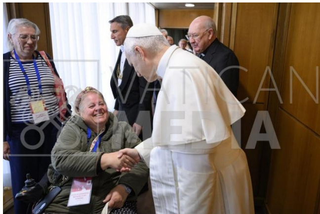
Nuestra Presidenta Olga saludando al papa León XIV

Ver enlace: https://www.vaticannews.va/es/papa/news/2026-05/leon-xiv-encuentro-moderadores-asociaciones-laicos-familia-vida.html