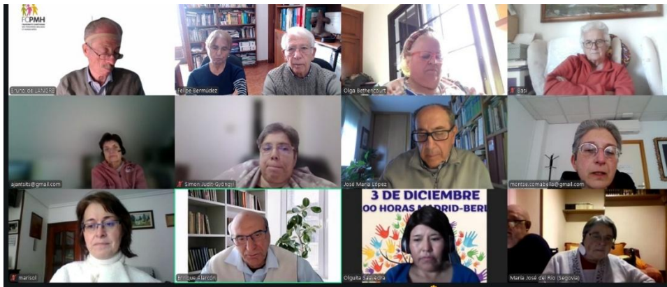
Reunión de la Comisión Sinodal, que se ha ampliado hasta 17 miembros de todos los continentes, con tres personas de Frater Las Palmas

Algunas de nuestras actividades a nivel intercontinental nos ayudan a ver otras dimensiones de nuestro trabajo en la Frater. Hay que valorar que nuestra Frater canaria participa en instancias y servicios amplios del Movimiento. Eso constituye un honor, por haber sido elegidas y enviadas estas personas para esa misión. Y constituye al mismo tiempo una responsabilidad. Porque entre tod@s tenemos que apoyar y acompañar el trabajo de esas personas.