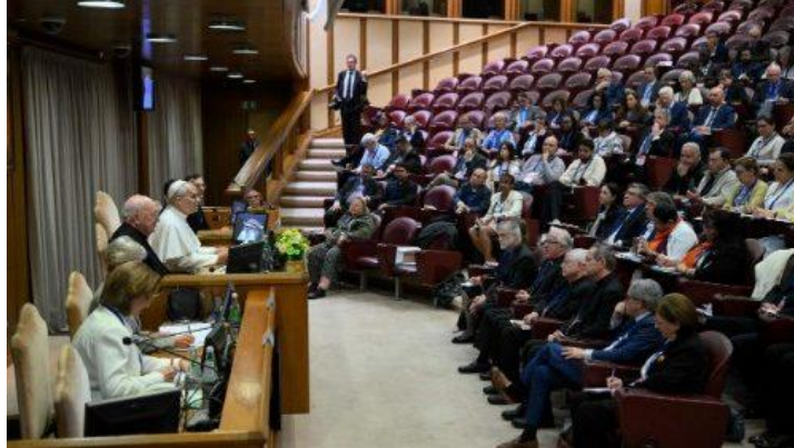
Escuchando, en primera fila, al papa León XIV