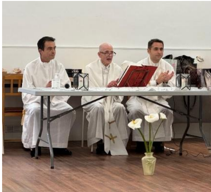
La presidencia de la Eucaristía

El Equipo Diocesano sigue reuniéndose cada quince días de manera telemática. Es ya una costumbre normal en nuestro Movimiento. Porque el Equipo vive en tres islas y el encuentro online es algo habitual. Se trabaja muy bien así. Varias veces al año es cuando podemos vernos de manera presencial. Esto ocurre cuando nos tenemos que desplazar a Gran Canaria con motivo de la Asamblea Diocesana. O cuando hay algún motivo extraordinario.